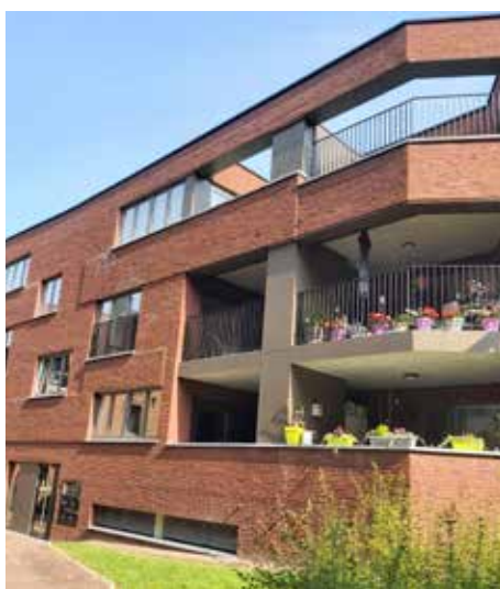
▲ Sociale woningen Urselinenstraat

Alleenstaanden met kinderen ondervinden vaker moeilijkheden in de zoektocht naar een geschikte en betaalbare woning. Om tegemoet te komen aan de stijgende vraag naar sociale woningen bij deze doelgroep voorziet schepen Jelle Engelbosch een voorrangregeling voor alleenstaande ouders met minstens één minderjarig kind.